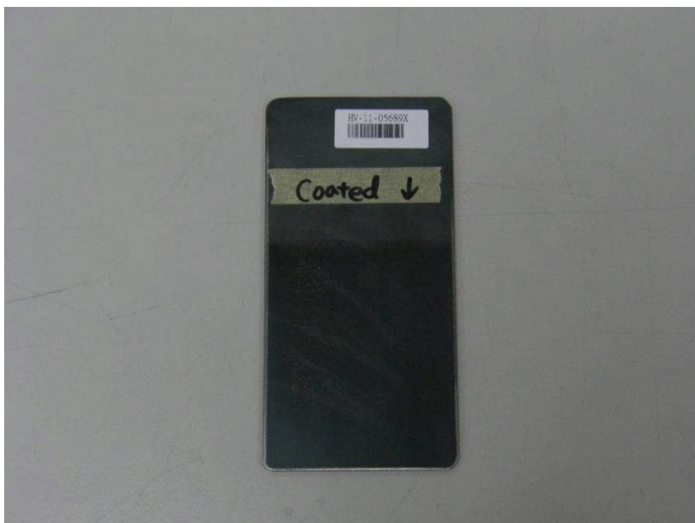
Тестируемый образец (coated = покрытие)